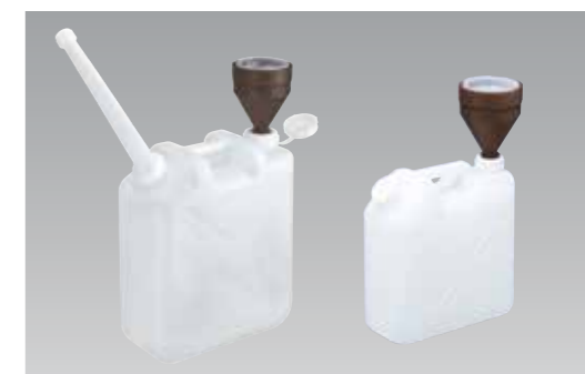
左:0836,2041N装着イメージ 右:0839装着イメージ

●0836-0839の違いはキャップの大きさです。 ■通常在庫品 ■3～5日 ■7～10日 ※寸法には許容差があります。(単位mm) ■材質/ポリエチレン(PE) ■製造国/日本