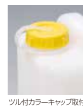
ツル付カラーキャップ取付例