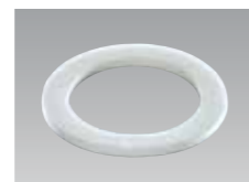
パッキン(ポリエチレン発泡体)

■通常在庫品 ■3～5日 ■7～10日 ※寸法には許容差があります。(単位mm) ■材質/ポリエチレン(PE) ■製造国/日本