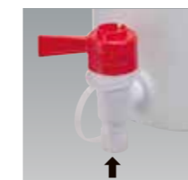
液ダレ防止先端キャップ (コックは取り外しできません)