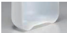
内面底部に凹凸があります。