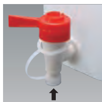
液ダレ防止先端キャップ (コックは取り外しできません)